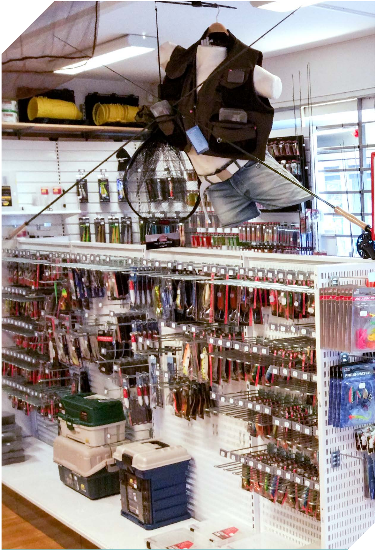
Under perioden har vi infört delar av vårt fiskesortiment hos Kallinge Radio i Ronneby.