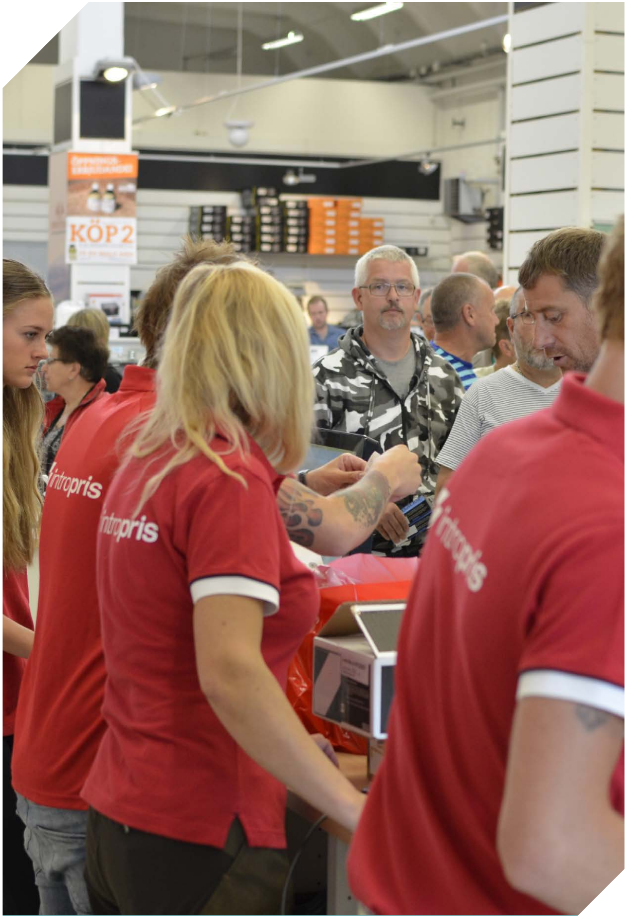
Butikspersonalen hade fullt upp under den välbesökta invigningen av Intropris-butiken i Eksjö